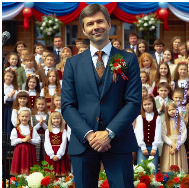
Иллюстративное фото / newUROKI.net

Вам понравилась наша юмористическая сценка? Заметьте, в этом жутком капиталистическом мире, мы не просим у Вас денег, не закрываем часть текста и не требуем ваш e-mail для того, чтобы Вы могли узнать продолжение. Всё для учителя — всё бесплатно! Это наш лозунг. Взамен просим только одного. Если Вам понравилось — дайте ссылку на эту страницу в ваших социальных сетях. А когда будете размещать текст этой сценки на своих сайтах — пожалуйста, поставьте ссылку на наш сайт.