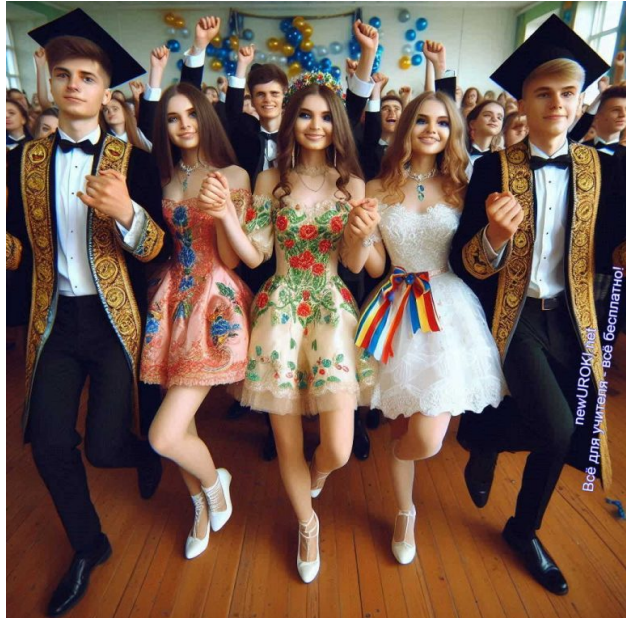
Иллюстративное фото / newUROKI.net