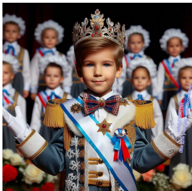
Иллюстративное фото / newUROKI.net

Первоклассник: (с улыбочкой подходит к выпускнице и гладит её по голове) Не плачь, деточка. Решу я вашу проблему.