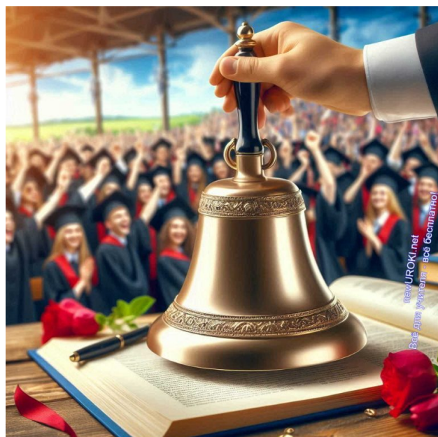
Иллюстративное фото / newUROKI.net

Директор: (произнося в сторону) Ну-ну... Маленькие... Кхх... Слабенькие... Сейчас детишки такие, что они в состоянии сломать даже кусок рельсы!