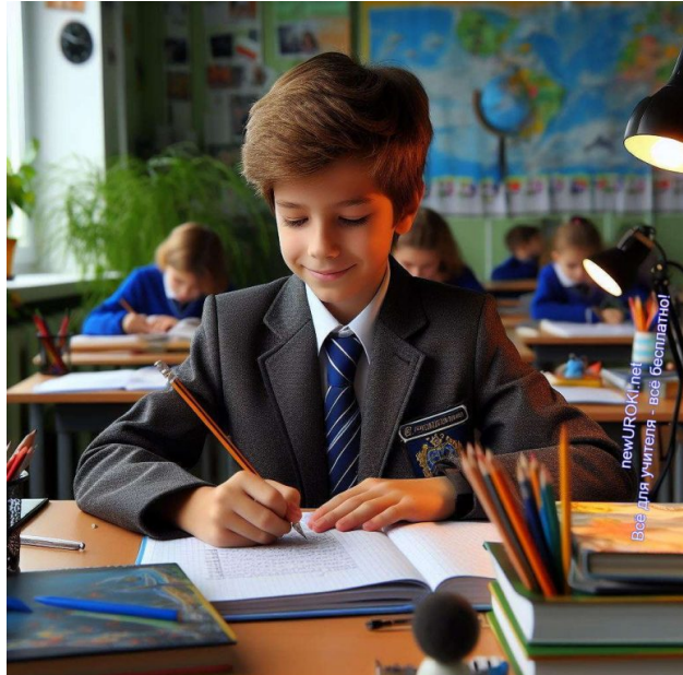
Иллюстративное фото / newUROKI.net