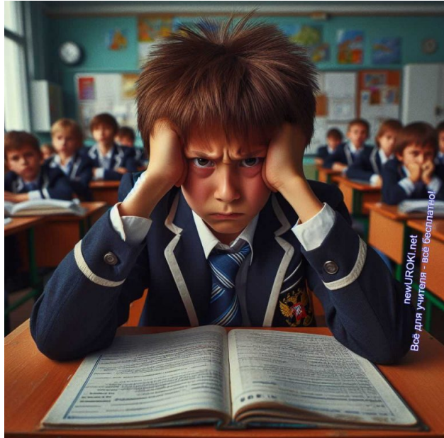
Иллюстративное фото