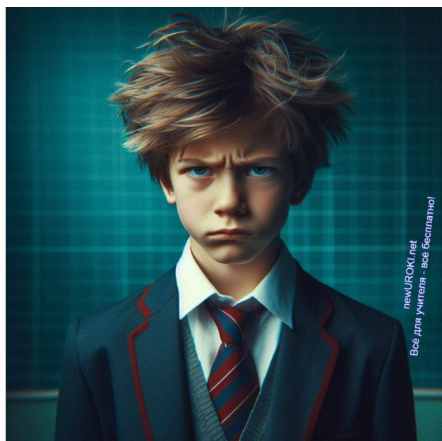
Иллюстративное фото / newUROKI.net

Социальная адаптация ученика также вызывает опасения. Он не обладает навыками эффективного общения с окружающими, что приводит к конфликтам и изоляции от сверстников. Его агрессивное поведение и склонность к провокациям вносят дисгармонию в классную атмосферу, что делает его непопулярным среди одноклассников.