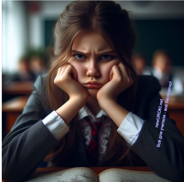
Иллюстративное фото / newUROKI.net

Маша также имеет проблемы с самодисциплиной и самоконтролем. Она не проявляет ответственности в выполнении своих учебных и внешкольных обязанностей, не способна к самоорганизации и часто нарушает школьные правила.