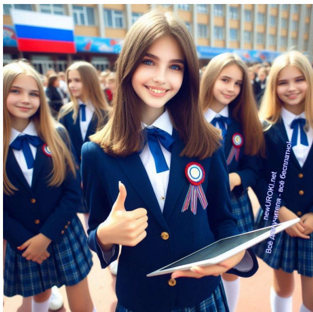
Иллюстративное фото / newUROKI.net

Стоит прочесть также: Профессия: судостроитель - профориентационный урок "Россия - мои горизонты"