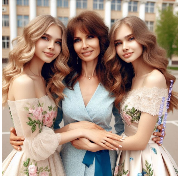
Иллюстративное фото / newUROKI.net

Ребята, сейчас, когда мы собрались здесь в этом зале, я хочу выразить вам искреннюю благодарность. Благодарность за то, что вы были рядом в течение всех этих лет, что каждый день вы приходили на уроки, стремились к знаниям и делились своими мыслями и эмоциями. Спасибо, что были частью нашего классного коллектива, что создавали теплую и дружескую атмосферу в нашей школе.