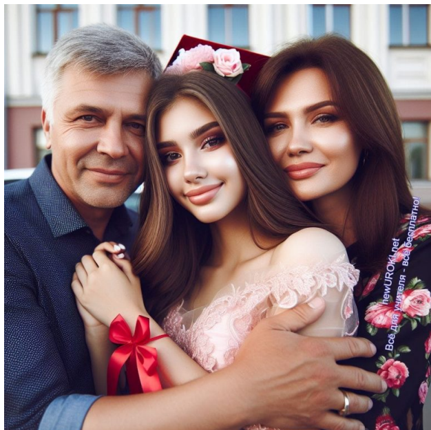
Иллюстративное фото / newUROKI.net

Дорогие мои ученики, сегодня перед вами открывается особенный момент, когда я хочу выразить вам искреннюю благодарность и признательность за все, что вы сделали в течение этих лет. Вы стоите на пороге новой жизни, и я хочу поделиться некоторыми мыслями и словами признания.