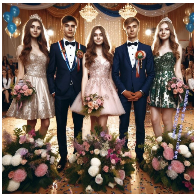
Иллюстративное фото / newUROKI.net

Наш последний классный час подходит к концу. Настало время прощания. Время, когда мы стоим перед порогом новых начинаний, но в то же время чувствуем тяжесть расставания с тем, что было частью нашей жизни так долго. Это эмоциональный момент, когда мы прощаемся с школой и с теми, кто был с нами рядом все эти годы.