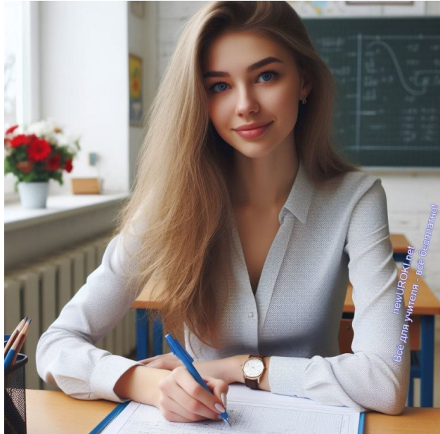
Иллюстративное фото / newUROKI.net