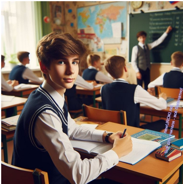
Иллюстративное фото / newUROKI.net

Структура чек-листа учителя может иметь различные формы и варианты в зависимости от конкретных задач и особенностей урока. Рассмотрим типичные компоненты и пункты, которые могут включаться в список задач.