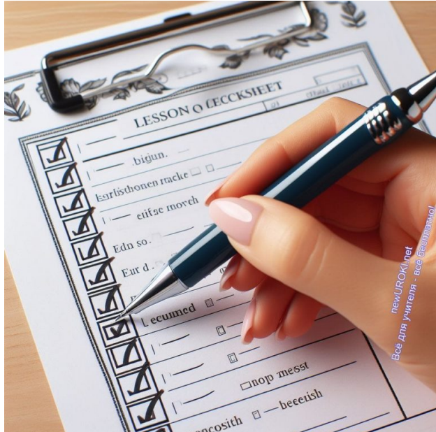
Иллюстративное фото / newUROKI.net

Для молодого педагога, только начинающего свой путь в мире образования, чек-лист становится неоценимым инструментом, который помогает не только в организации учебного процесса, но и в развитии профессиональных навыков. Давайте рассмотрим, какие преимущества применения этого инструмента могут быть особенно полезны для начинающих учителей.