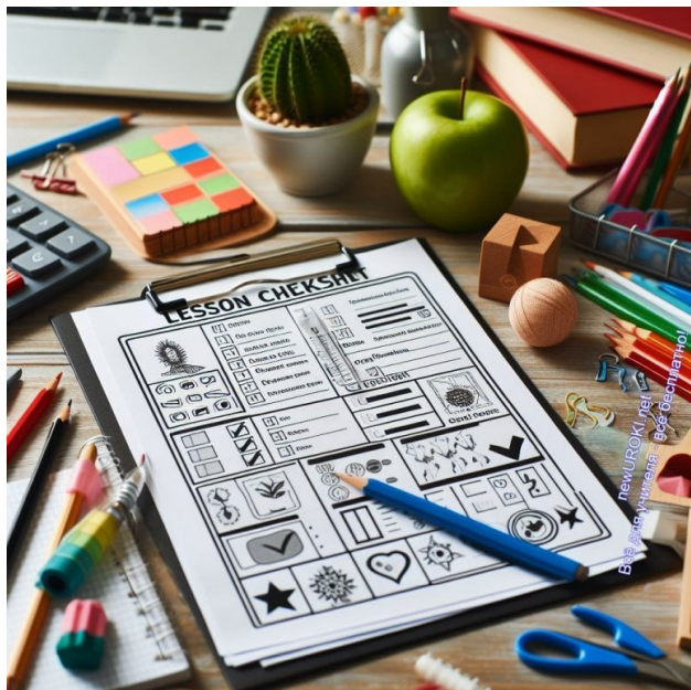
Иллюстративное фото / newUROKI.net

Чек-лист учебного занятия выполняет множество функций, играя важную роль в организации и проведении урока.