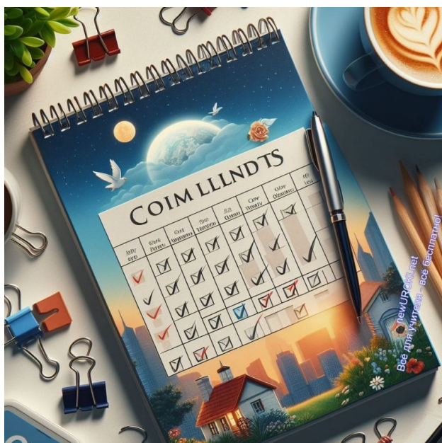
Иллюстративное фото / newUROKI.net